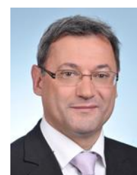
Cher Circonscription n°2

Le site web : groupe-communiste.assemblee-nationale.fr