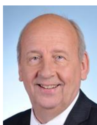
Nord Circonscription n°17