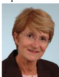
Hauts-de-Seine Circonscription n°4