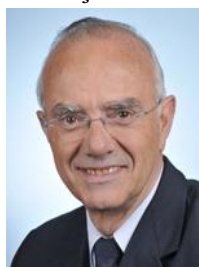
Seine-Saint-Denis Circonscription n°11