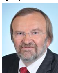
Nord Circonscription n°16