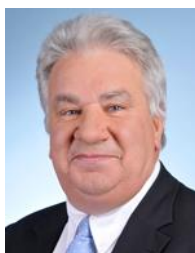
Oise Circonscription n°6