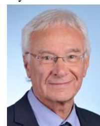
Bouches-du-Rhône Circonscription n°13